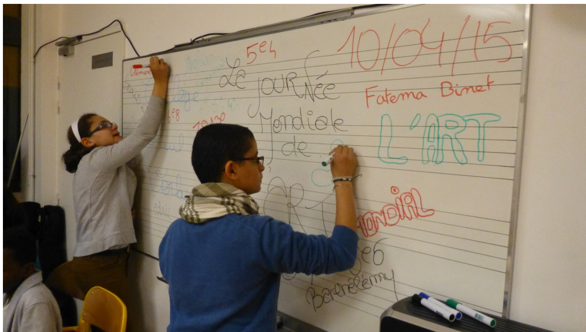
L INITIATIVE DES DEUX ELEVES MARQUANT SUR LE TABLEAU LA JMA